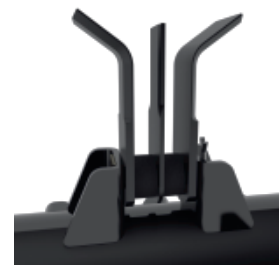
3 Cuchillas (opcional)