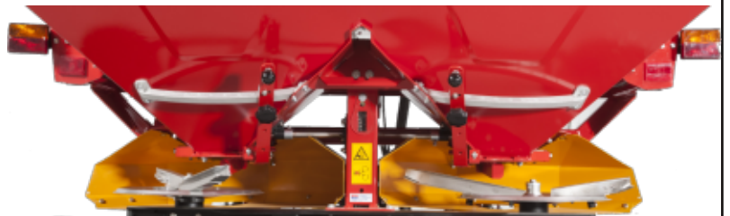
Sistema esparcidor de doble disco para un mayor ancho de trabajo y más precisión en la distribución del abono.