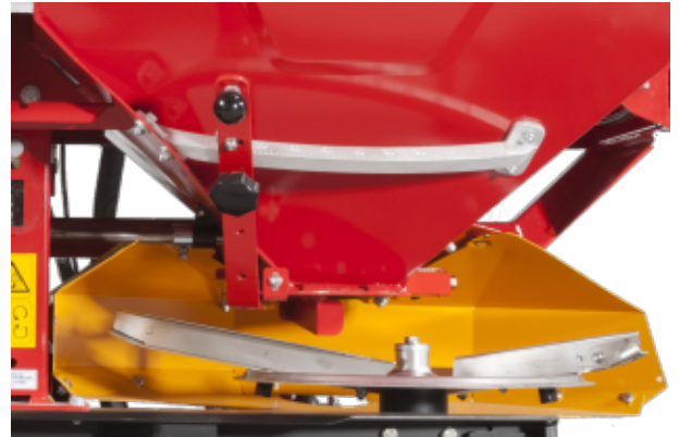
Ancho de trabajo ajustable desde el tractor. Discos y aletas esparcidoras en acero inoxidable.