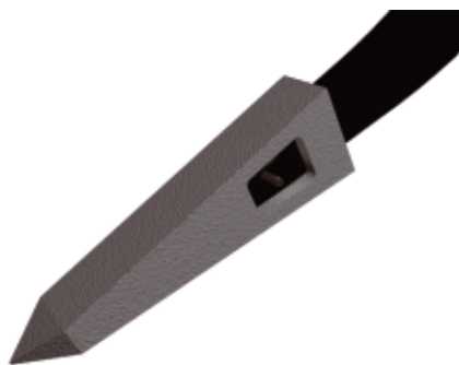
Punta reversible de material resistente al desgaste.