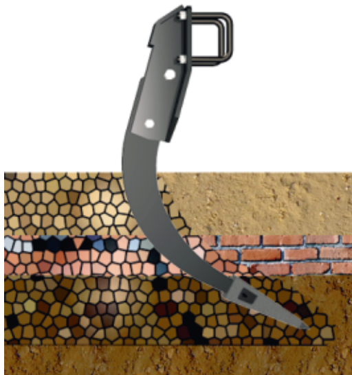
Cinzel semiflexible que afloja por vibración con un bajo consumo de potencia. Gran distancia entre la punta del cinzel y el marco (800 mm.) para mayor profundidad de trabajo.