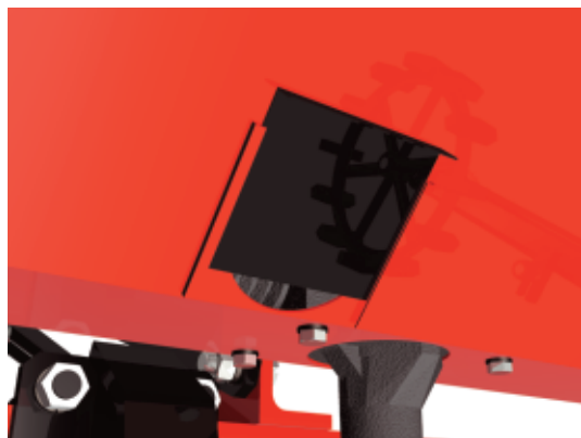
Compuerta de descarga para facilitar la limpieza de la tolva.